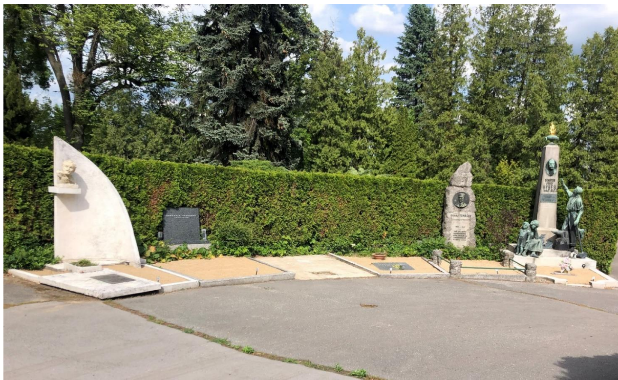
Fotografie místa pro vizualizaci výtvarného řešení náhrobku (foto ve velkém rozlišení v příloze)

Pro bližší orientaci a informace lze využít uživatelskou podporu tel: +420 538 702 719, e-mail: podpora@ezak.cz , (v pracovní dny).